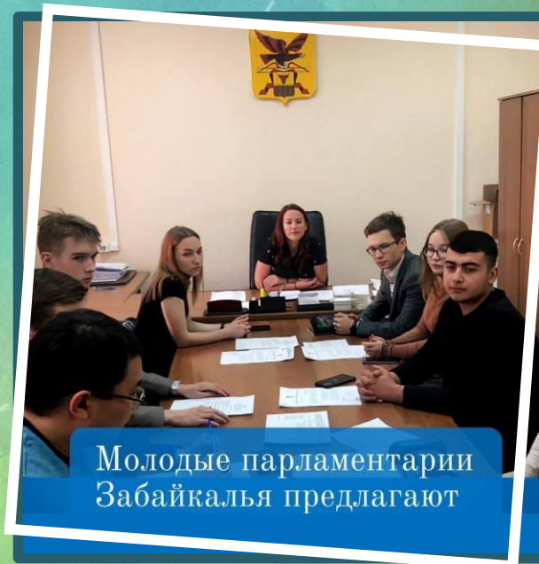
Молодые парламентарии Забайкалья предлагают

Продолжится развитие молодёжного парламентаризма, проект «ПРОФИ В ДЕЛЕ», Форум молодых парламентариев Забайкалья и др. Запуск нового национального проекта «Семья» даст дополнительное финансирование демографическим программам Забайкальского края