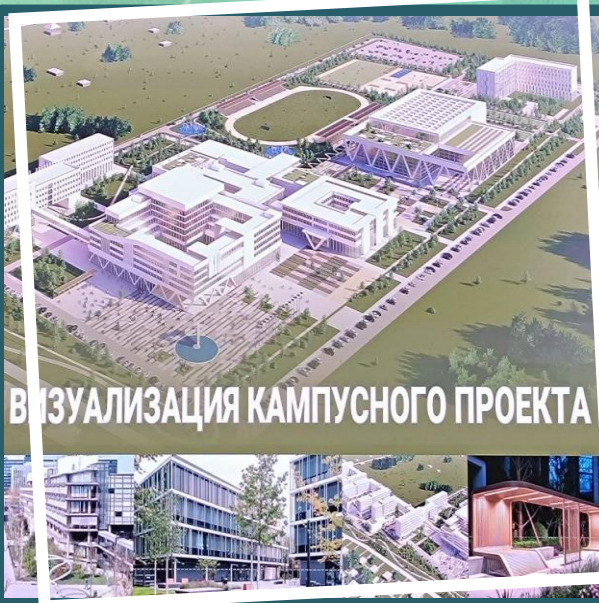
ВИЗУАЛИЗАЦИЯ КАМПУСНОГО ПРОЕКТА

К приоритетным проектам в Забайкальском крае относится строительство межвузовского кампуса «Континент» в Чите и научный центр Института истории, археологии и этнографии Дальневосточного отделения РАН, что будет способствовать научному прогрессу в регионе, привлечению молодых ученых и укреплению исследовательского потенциала Забайкальского края