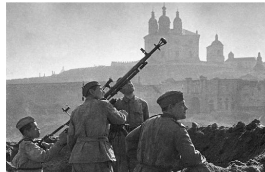
Смоленское сражение 1941 года