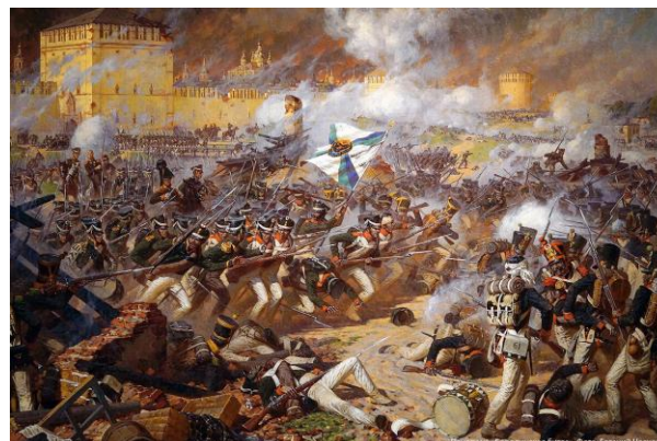
Смоленское сражение в августе 1812 года