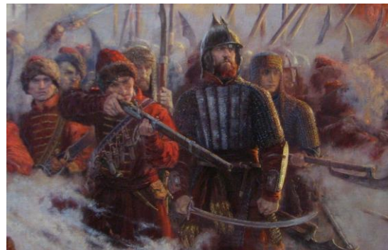
Героическая оборона Смоленска 1609–1611 гг.

Первое упоминание о Смоленске относится к 863 году, что отражено в летописи «Устюжский летописный свод»