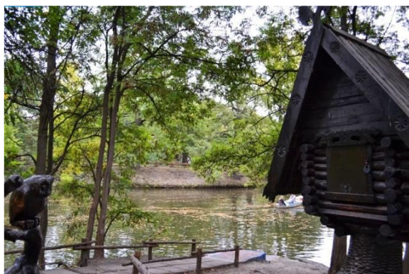
Городской парк (Саратов)

На территории парка действует Саратовский государственный музей боевой славы, который представляет своим посетителям огромную коллекцию оружия и военной техники времен Великой Отечественной войны, а также современные образцы вооружений. На экспозиции сельскохозяйственной техники представлено все – от плуга до комбайна, включая полевой стан. В музее действует аудиогид. Более двухсот экспонатов получили индивидуальное звуковое сопровождение.