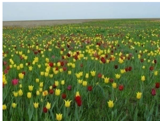
Тюльпанные степи (Новоузенский район)

Для того чтобы увидеть ездовую породу собак хаски, окунуться в мир настоящей дружбы, необязательно следовать на север. Теперь это легко сделать в Саратове. Питомник DogWinter расположен всего в 30 минутах езды от города.