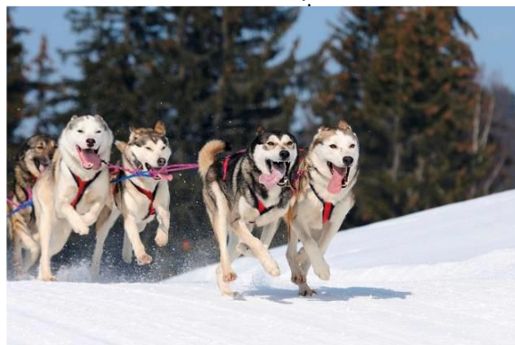
Догтрекинг «В гости к хаски» (г. Саратов)

мирт, маракуйя, пассифлора, бересклет, муррайя. Здесь часто проводятся экскурсии, которые не оставляют равнодушными ни детей, ни взрослых.