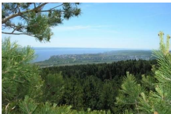
Национальный парк «Хвалынский» (Хвалынский район)

Меловой карьер – уникальное явление, созданное человеком и дополненное природой. В разрезе, сделанном ковшем экскаватора, видны останки живых существ, обитавших на территории Саратовской области миллионы лет назад.