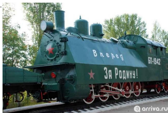
Парк Победы (Саратов)

В Саратове, на берегу Волги, впервые поднялся в небо воспитанник саратовского аэроклуба Юрий Гагарин – будущий первый в мире космонавт. На Саратовской земле он приземлился после своего полета в космос. 12 апреля 1961 года вблизи города Энгельса жители села Смеловка услышали взрыв в небе и увидели спускающиеся на землю два парашюта. Новинкой с 2019 года стало то, что родители и дети могут попробовать настоящее космическое питание из тюбиков, точно такое же, как у космонавтов во время полетов!