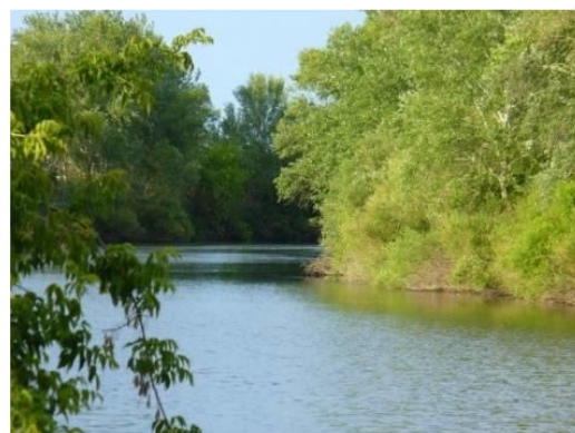
Дьяковский лес (Краснокутский район)

«Лесные фантазии» – детская экологическая тропа со сказочными героями, которые знакомят с лесом и его обитателями.