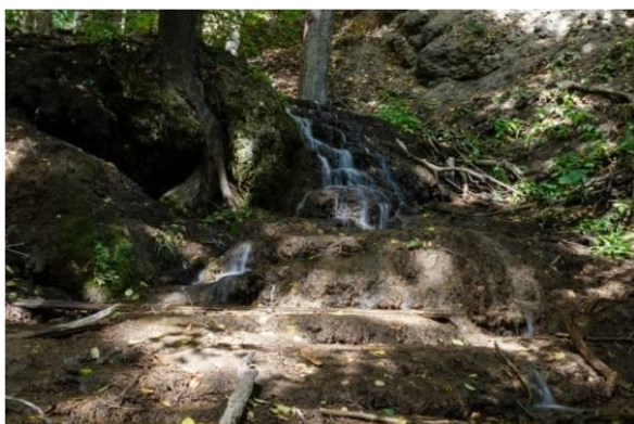
Водопады реки Еланки (Красноармейский район)

Кудеярова пещера – ландшафтный и историко-культурный памятник природы. Это место овеяно множеством легенд и поверий. Здесь и истории о разбойнике Кудеяре, и рассказы о зарытых сокровищах.