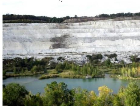
Маршрут «Тайны мелового карьера» (Вольский район)

Кумысная поляна – огромный воздушный фильтр, который каждый день пропускает через себя миллионы кубометров воздуха, очищая их от угарного газа, вредных примесей и насыщая кислородом.