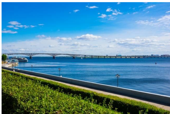
Набережная Космонавтов (г. Саратов)

Фестиваль традиционно проходит на месте, где в XIII-XIV веках находился один из крупнейших городов Золотой Орды, в настоящее время всемирно известный археологический памятник средневековой культуры народов Поволжья.