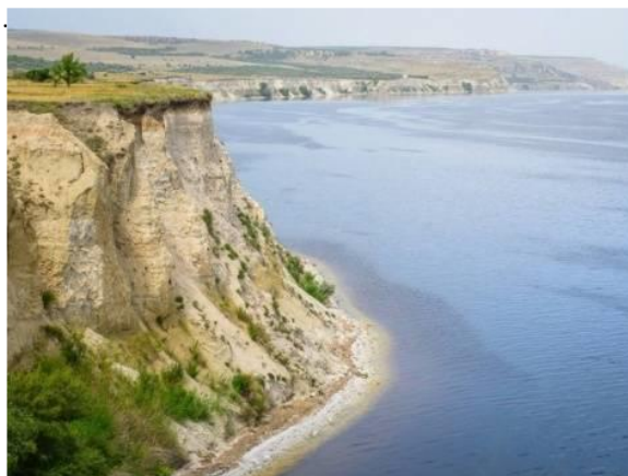
«По следам предков» (Красноармейский район)

В русле ручья, образованного родником, из-за разной твердости горных пород и резкого перепада высот образовались небольшие пороги и водопады, придающие ручью почти горный характер.