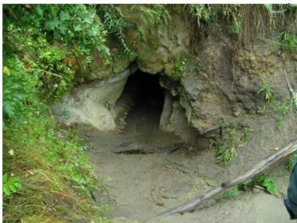
«Тропою Кудеяра» (Новобурасский район)

Кудеярова пещера – ландшафтный и историко-культурный памятник природы. Это место овеяно множеством легенд и поверий. Здесь и истории о разбойнике Кудеяре, и рассказы о зарытых сокровищах.