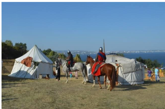
Фестиваль «Укек. Один день из жизни средневекового города»

и его узнаваемое колесо обозрения «Русские узоры», которое приобрело новый облик и стало настоящим арт-объектом.