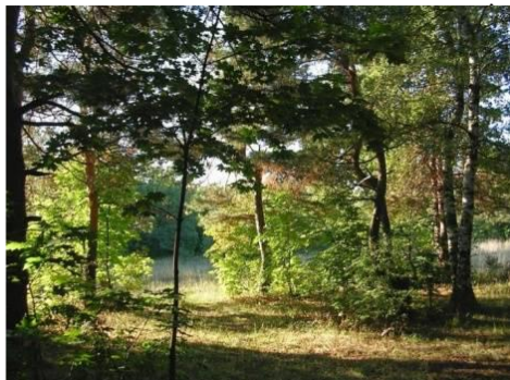
Природный парк «Кумысная поляна» (Саратов)

Можно посетить разные интересные и красивые места, пройти туристическими маршрутами.