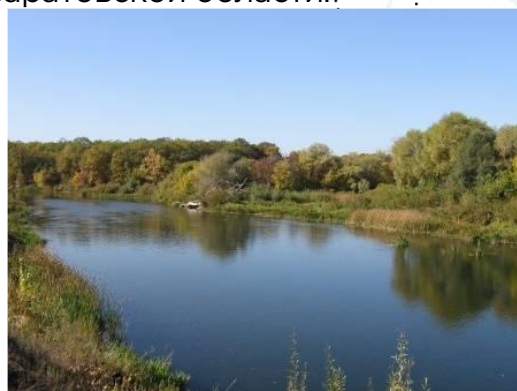
Озеро Рассказань (Балашовский район)

Знаменитый утес Степана Разина, о котором рассказывают фантастические легенды, складывают песни и пишут литературные произведения, признан археологическим памятником природы и самым посещаемым туристами местом Саратовской области.