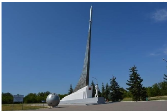
«Начало космического пути» (Энгельсский район)

В Саратове, на берегу Волги, впервые поднялся в небо воспитанник саратовского аэроклуба Юрий Гагарин – будущий первый в мире космонавт. На Саратовской земле он приземлился после своего полета в космос. 12 апреля 1961 года вблизи города Энгельса жители села Смеловка услышали взрыв в небе и увидели спускающиеся на землю два парашюта. Новинкой с 2019 года стало то, что родители и дети могут попробовать настоящее космическое питание из тюбиков, точно такое же, как у космонавтов во время полетов!