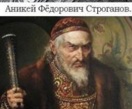
Аникей Фёдорович Строганов.