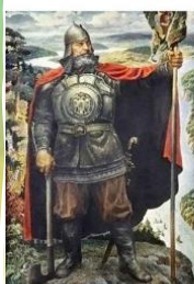
Ермак Тимофеевич -

Колонизация Сибири. Строительство Транссибирской железнодорожной магистрали и Московско- Сибирского тракта. Реформа М.М. Сперанского. ВОВ. Освоение целинных земель.