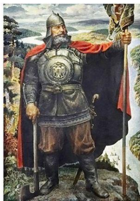
Ермак Тимофеевич - покоритель Сибири

Колонизация Сибири. Поход казачьей дружины Ермака Тимофеевича. Строительство Транссибирской железнодорожной магистрали и Московско- Сибирского тракта. ВОВ.