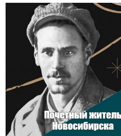
Почётный житель Новосибирска

Какие народы традиционно населяли Новосибирскую область? Какие ремёсла были популярны?