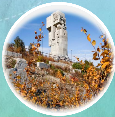
ТУРИЗМ И ДОСТОПРИМЕЧАТЕЛЬНОСТИ

Научные исследования и разработки в регионе проводят Северо-Восточный комплексный научно-исследовательский институт им. Н.А. Шило ДВО РАН, научно-исследовательский центр «Арктика» ДВО, Магаданский НИИ сельского хозяйства, Магаданский филиал Всероссийского научно-исследовательского института рыбного хозяйства и океанографии, Северо-Восточная научно-исследовательская мерзлотная станция – научная лаборатория института мерзлотоведения им. П.И. Мельникова Сибирского отделения РАН. Подготовку кадров в регионе осуществляют 9 образовательных учреждений: 1 учреждение высшего образования – Северо-Восточный государственный университет (1960) и 8 организаций – среднего профессионального образования.