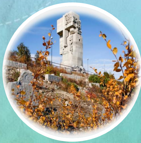
ТУРИЗМ И ДОСТОПРИМЕЧАТЕЛЬНОСТИ

Научные исследования и разработки в регионе проводят Северо-Восточный комплексный научно-исследовательский институт им. Н.А. Шило ДВО РАН, научно-исследовательский центр «Арктика» ДВО, Магаданский НИИ сельского хозяйства, Магаданский филиал Всероссийского научно-исследовательского института рыбного хозяйства и океанографии. Подготовку кадров в регионе осуществляют 9 образовательных учреждений: 1 учреждение высшего образования – Северо-Восточный государственный университет (1960, Магадан) и 8 – среднего профессионального образования.