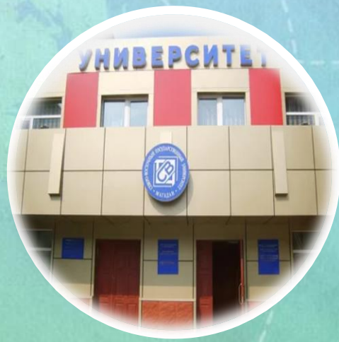
ОБРАЗОВАНИЕ И НАУКА

Основу производственной сферы области составляют горнодобывающая, энергетика и пищевая отрасли. Развиты транспорт и связь, добыча и переработка рыбы. В структуре промышленного производства главенствующее место занимает золотодобывающая отрасль. Развитие горнодобывающей отрасли территории связано с деятельностью крупнейшего предприятия региона - компанией АО «Полиметалл», Планируемое в 2024 – 2026 годах увеличение добычи драгоценных металлов обусловлено увеличением объемов добычи рудного золота на месторождениях «Павлик», «Наталкинское».