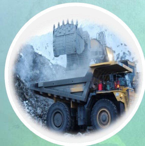
ЭКОНОМИКА И ПРОМЫШЛЕННОСТЬ

Основу производственной сферы области составляют горнодобывающая, энергетика и пищевая отрасли. Развиты транспорт и связь, добыча и переработка рыбы. В структуре промышленного производства главенствующее место занимает золотодобывающая отрасль. Развитие горнодобывающей отрасли территории связано с деятельностью крупнейшего предприятия региона - компанией АО «Полиметалл», Планируемое в 2024 – 2026 годах увеличение добычи драгоценных металлов обусловлено увеличением объемов добычи рудного золота на месторождениях «Павлик», «Наталкинское».