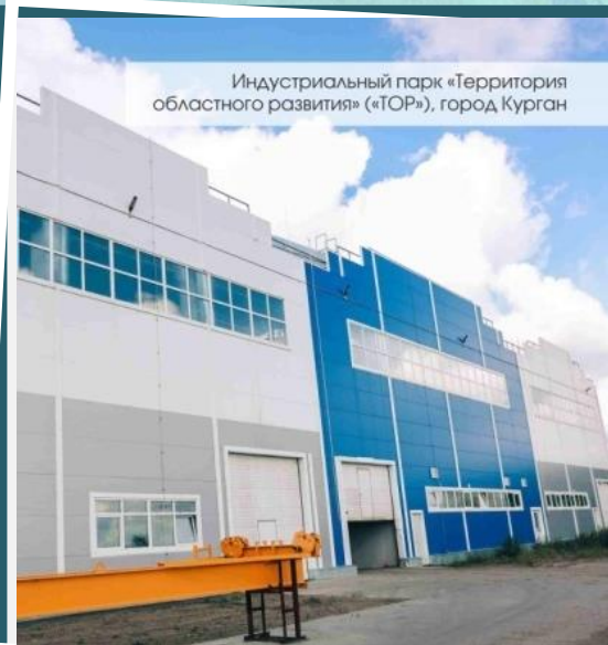
Индустриальный парк «Территория областного развития» («ТОР»), город Курган