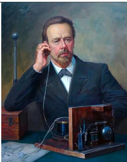
Иван Дмитриевич Шадр

Герой Советского Союза, генерал-полковник 64-й армии, который во время Сталинградской битвы взял в плен командира 6-й немецкой армии генерал-фельдмаршала Паулюса.