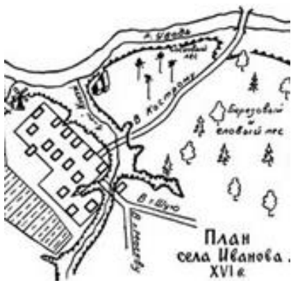
План села Иваново XVI в.