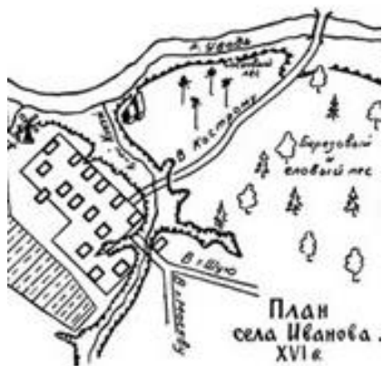
План села Иваново XVI в.