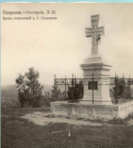
Ставрополь.—Ставрополь, № 10. Крест поставленный А. В. Суворовым.