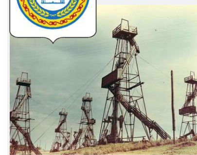
Нефтяные вышки - Старые промысла