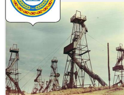
Нефтяные вышки - Старые промысла