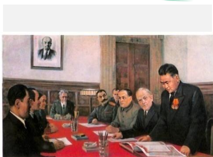
Заседание Президиума Верховного Совета СССР. С.К. Тока зачитывает просьбу Малого Хурала ТНР о принятии Тувы в состав СССР. 11 октября 1944 г.

Восстание 60-ти богатырей (Алдан Маадыр) Вхождение Тувы в состав СССР