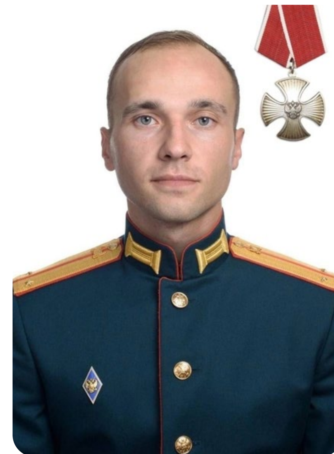
ДАНИЛ АЛЕКСЕЕВИЧ ПЕТРУШИН

На фасаде здания бюджетного общеобразовательного учреждения города Омска «Средняя общеобразовательная школа № 99 с углубленным изучением отдельных предметов» установлена мемориальная доска в честь героя.