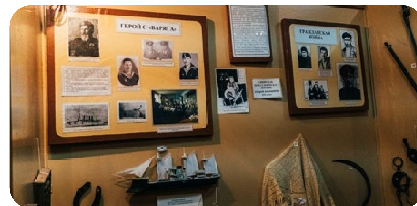
Стенд, посвященный Ф. Е. Михайлову, в Любинском краеведческом музее