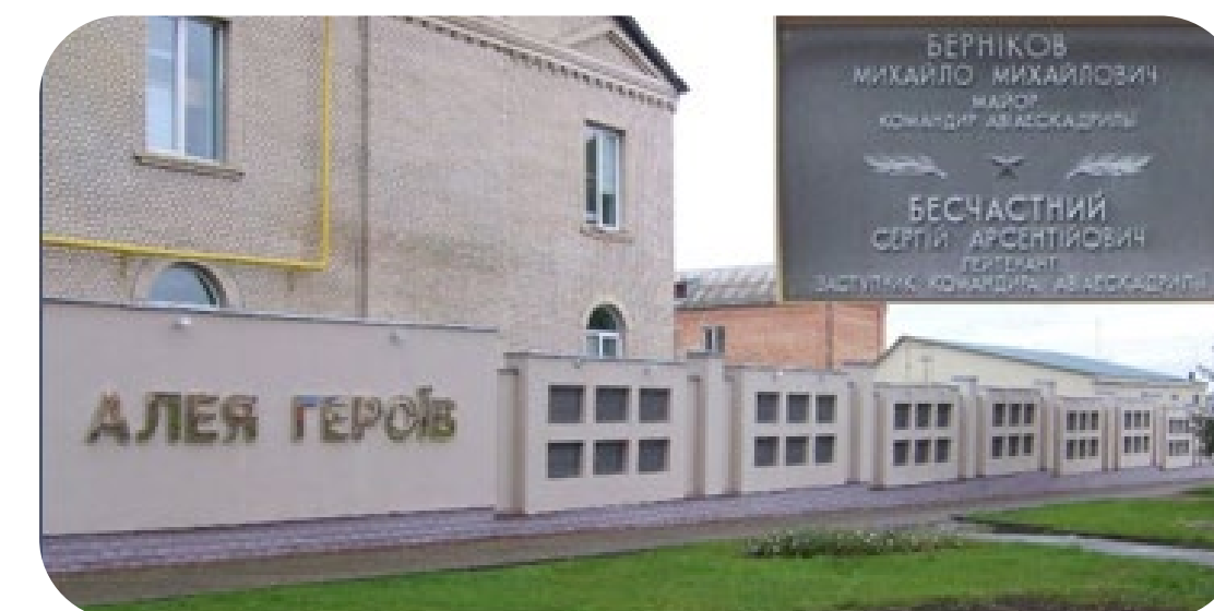
Мемориальная доска на аллее Героев в городе Корсунь-Шевченковском (Украина)