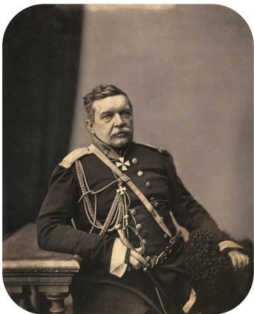
НИКОЛАЙ НИКОЛАЕВИЧ МУРАВЬЕВ-КАРСКИЙ (1794–1866)

Местность проживания: с. Скорняково (ныне — Задонский округ Липецкой области)