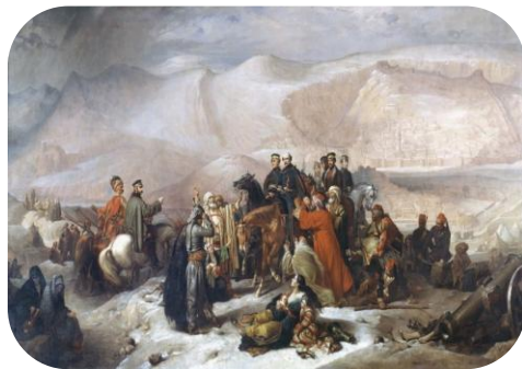
Томас Джонс Баркер «Сдача Карса, Крымская война, 28 ноября 1855 г.»

Местность проживания: с. Скорняково (ныне — Задонский округ Липецкой области)