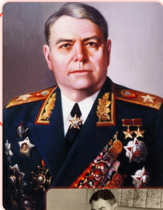
МАРШАЛ ВАСИЛЕВСКИЙ АЛЕКСАНДР МИХАЙЛОВИЧ

дважды кавалер ордена «Победа» и дважды Герой Советского Союза