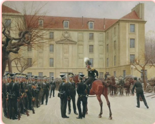
И. С. Розен. Гвардейский экипаж в Париже. 1814 год. (1911)

Невозможно увековечить память всех героев Отечественной войны 1812 года в камне или бронзе. Главное, чтобы память о них сохранялась среди живущих людей. Потому над акваторией Казанки возвышается храм-памятник всем воинам, в том числе участвовавшим и в этой войне.