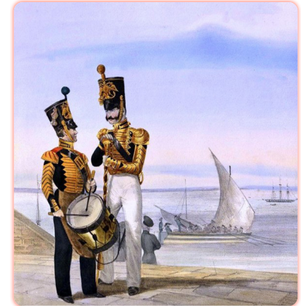
Изображение морских гвардейцев первой четверти XIX века. Литографированные иллюстрации из немецкого издания: Монтен Д.; Эккерт Г. А. Обмундирование Русской императорской армии. Рисовано с натуры.