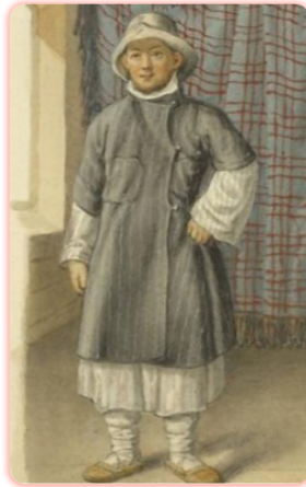
Казанские татары начала XIX века. Рисунок Ф. Г. Солнцева для собрания «Древности Российского государства» (1849–1853)

Матрос Кронштадтского гребного флота. Поступил на службу в 1791 году. Затем в 1802 г. переведен в Гвардейский морской экипаж, в составе которого провел Отечественную войну 1812 г. и совершил Заграничный поход русской армии до Парижа в 1814 г. По достижении 25 лет воинской службы был отставлен со службы «и отпущен на собственное пропитание».