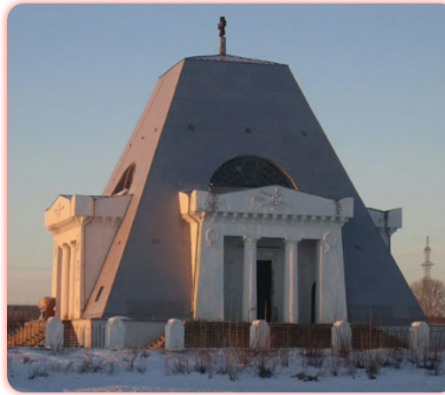
Храм-памятник павшим воинам в честь Нерукотворного Образа Спасителя, Казань